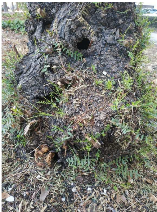
Imágenes del ejemplar con id 350