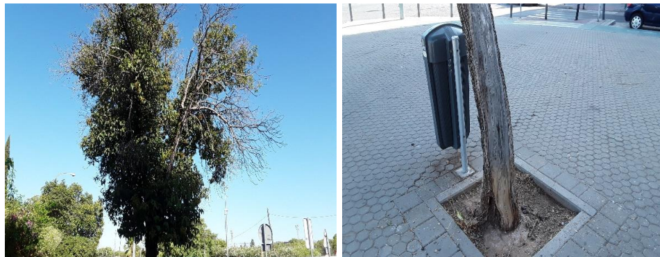
(Fotos correspondientes a la Inspección realizada el 20 de agosto de 2019)

Calle Nicolás Alpérez s/n (Pabellón de la Telefónica de la Exposición de 1929) 41013 Sevilla Teléfono 95 54 73232