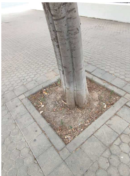
Imágenes del ejemplar con id 27681