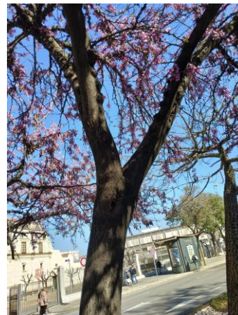
Imágenes del ejemplar con id 125571