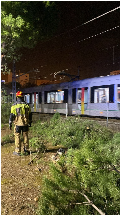
Imagen: Detalle actuación bomberos sobre ejemplar posteriormente apeado.