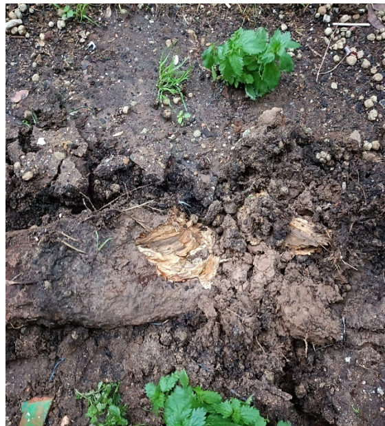
ID 151 - LIX