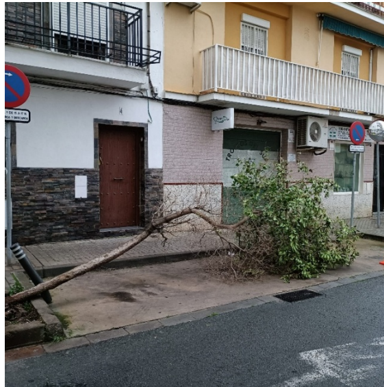
ID 151 - LIX