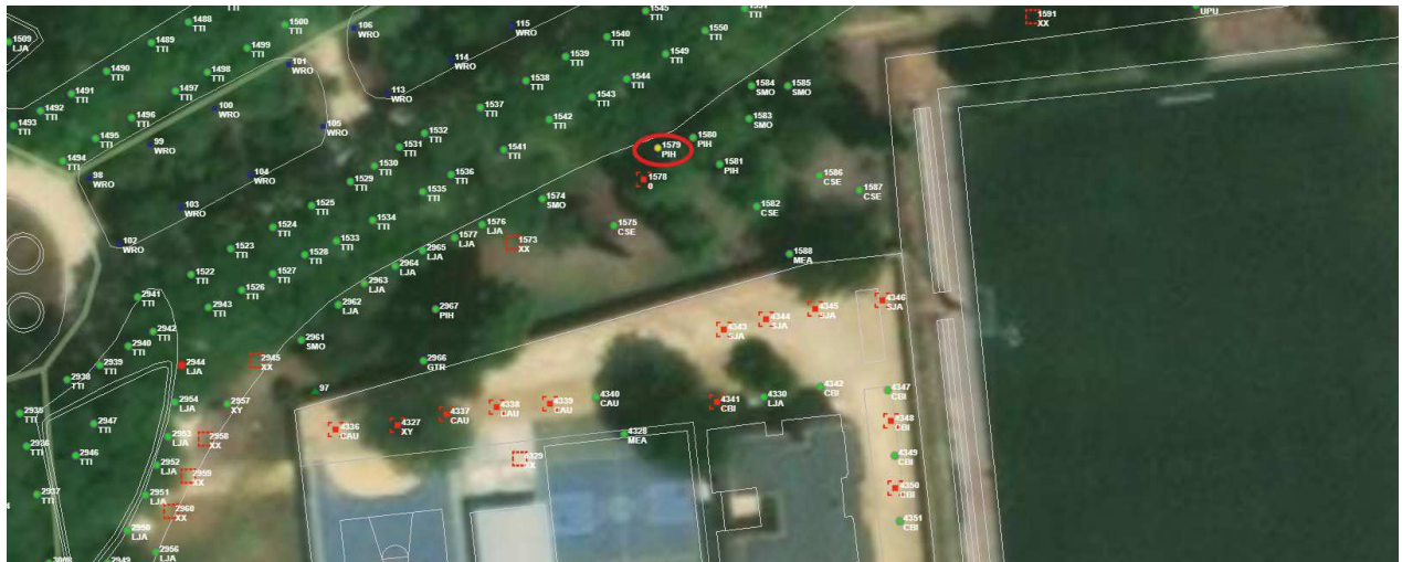
Localización del árbol