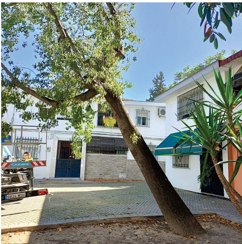
Imagen: BPX 1116