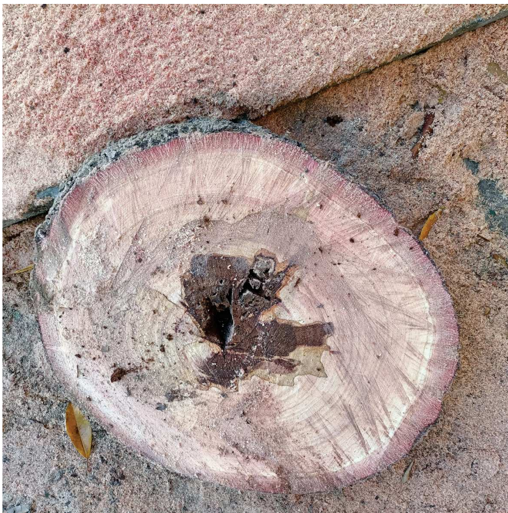
Imagen: BPX 1116