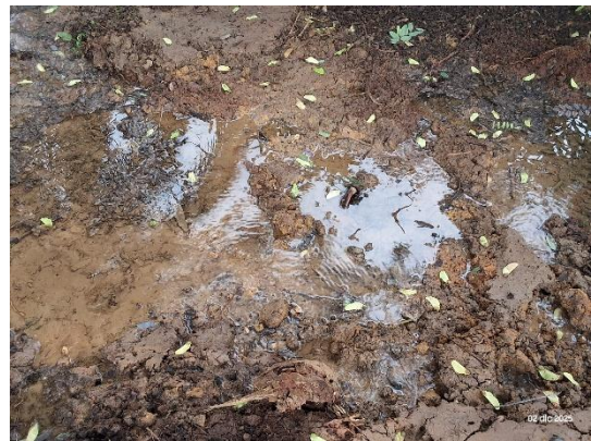
Imagen: TTI 113543.