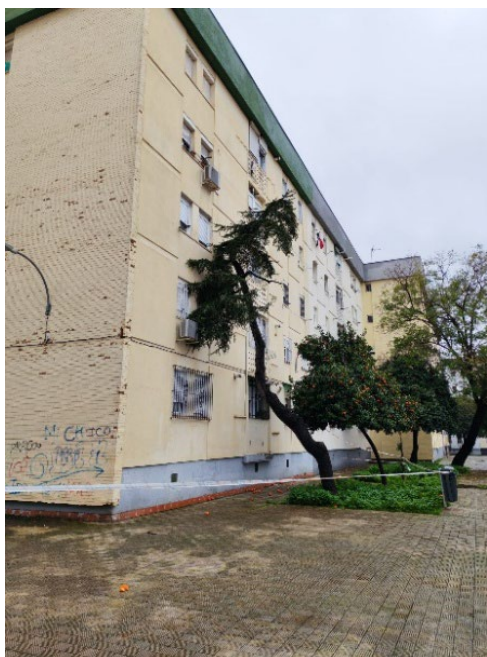
CDO – 111046