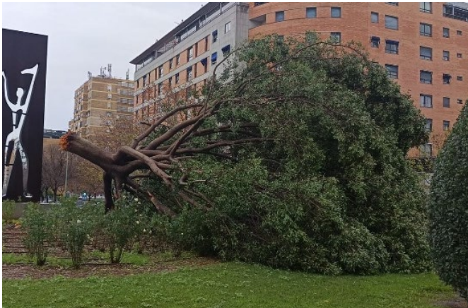
FMI - 70464