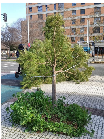
JAM – 119454