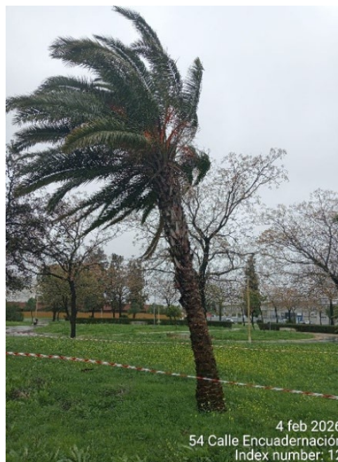
4 feb 2026 54 Calle Encuadernación Index number: 12