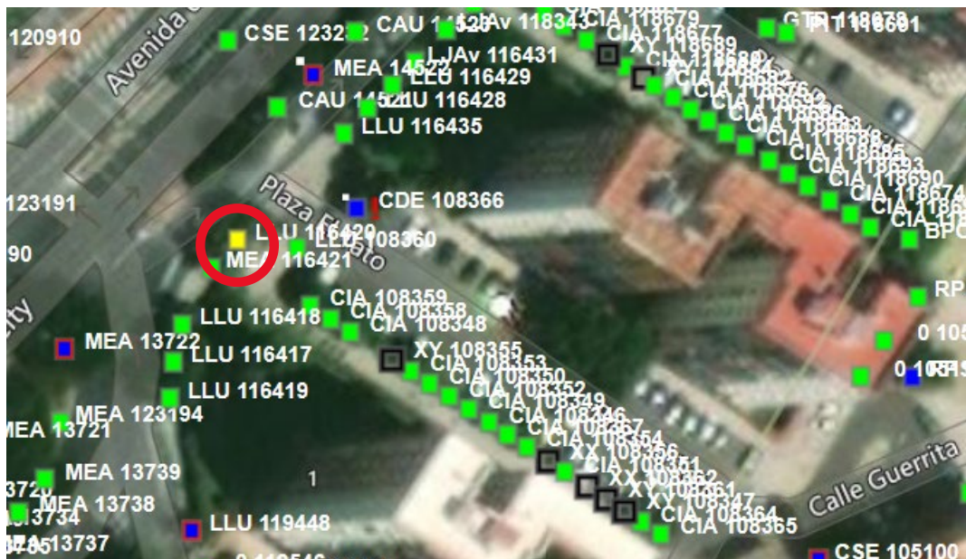
Imagen: LLU 116420