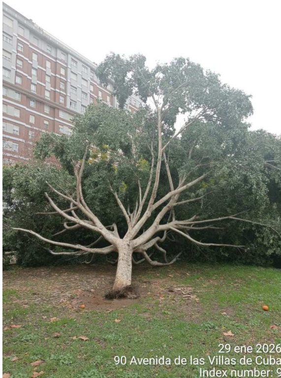
FMI – 70269