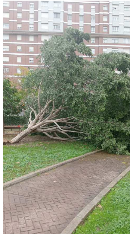
FMI - 70269