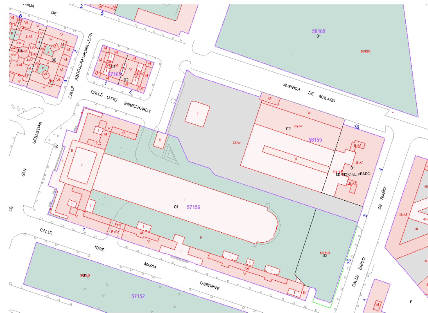
Imagen extraída de la página web del CASTASTRO (parcelas objeto de la implantación de las actuaciones del proyecto)

Se adjunta a continuación una imagen extraída de la página web del CASTASTRO, la certificación catastral de dichas parcelas y una planta general de la actuación definida en el presente proyecto.