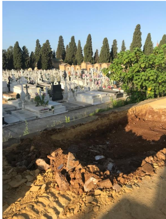
Inicio de los trabajos en la cuadrícula CD3.