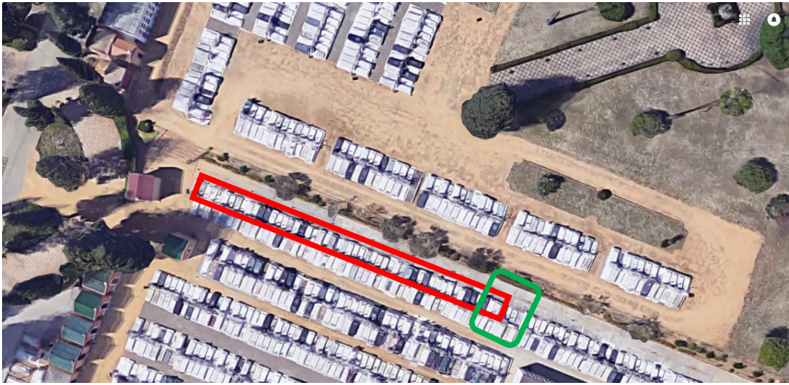
Área donde se proyecta la cuadrícula CD3.