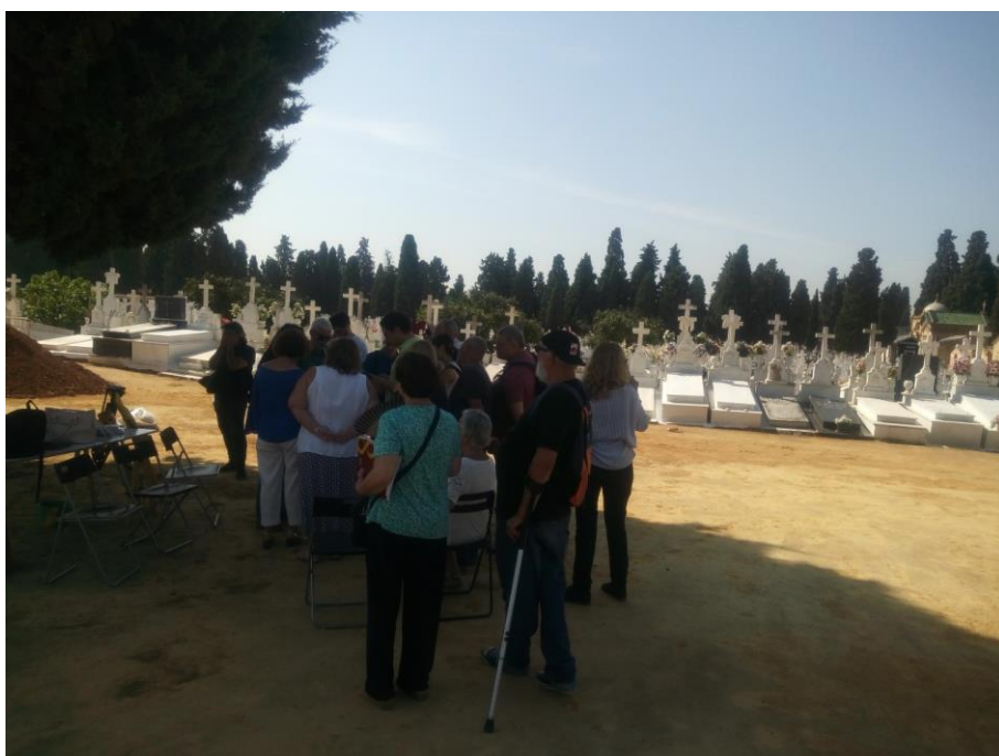
Jornada de “Puertas Abiertas”. Visita de familiares, autoridades y prensa.