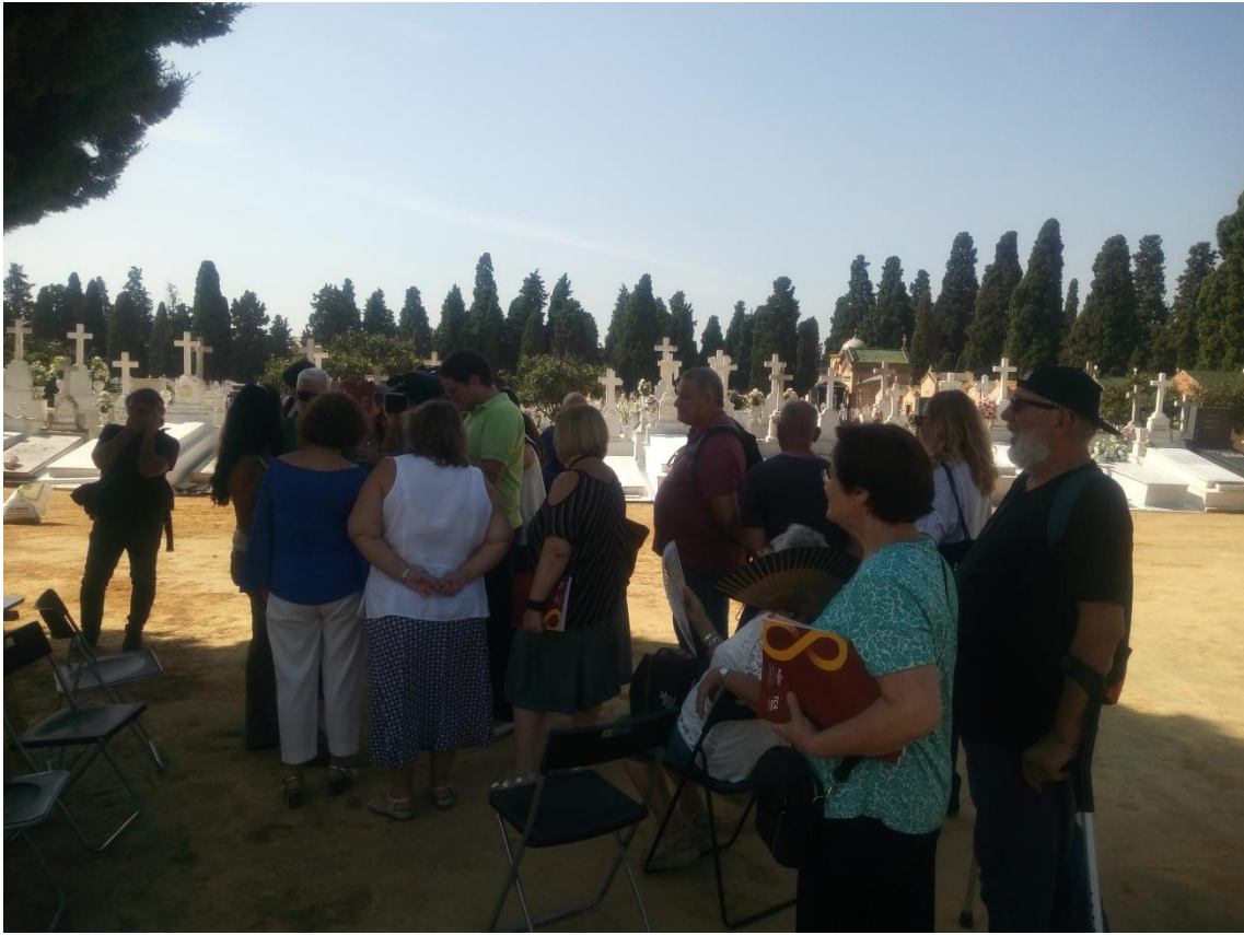
Jornada de "Puertas Abiertas". Visita de familiares, autoridades y prensa.